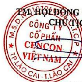
TRẦN MẠNH SƠN