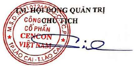
TRẦN MẠNH SƠN

Quy chế nội bộ về quản trị công ty Công ty Cổ phần Cencon Việt Nam bao gồm 07 mục, 19 điều và có hiệu lực thi hành kể từ ngày 26 tháng 07 năm 2024.