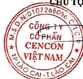
TRẦN MẠNH SƠN