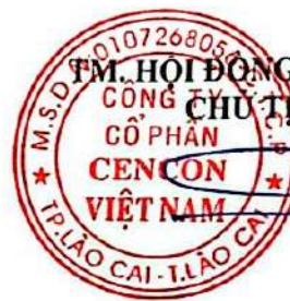
TRẦN MẠNH SƠN